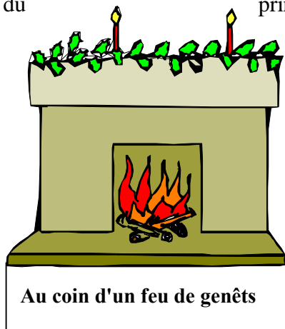
Au coin d'un feu de genêts

printemps. Ses hautes tiges fibreuse se garnissent de fleurs jaune d'or odorantes. Le genêt se maintient en vainqueur sur le sol froid et acide de l'Ardenne géologique caractérisé