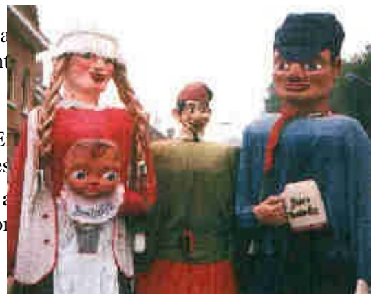
Une belle famille