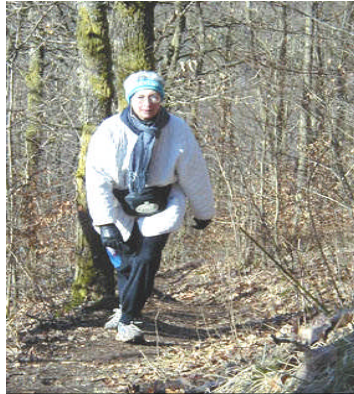
Vivement le sommet