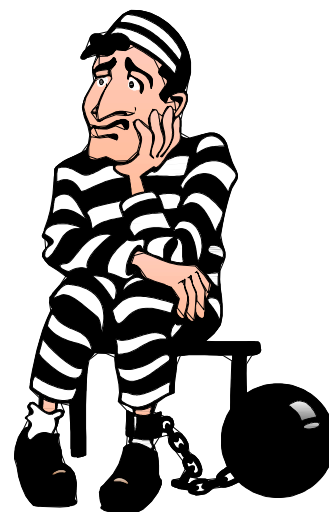
Le prisonnier du boulot

Notre père qui est au bureau Que le travail soit léger Que les patrons partent en vacances, Que notre volonté soit faite Au bureau comme à la maison. Donne nous aujourd'hui un jour de congé, Une semaine de récupération Et un mois de réflexion. Pardonne nous nos absences Comme nous pardonnons aussi A ceux qui nous font travailler. Ne nous soumet pas aux observations, Aux baisses de salaire, Aux embargos et aux heures supplémentaires Mais délivre nous de cet enfer Car c'est à toi qu'appartient le pouvoir D'augmenter notre salaire et nos jours de congé Tout en diminuant notre travail. Amen Transmis par un anonyme que je remercie.