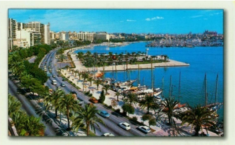
PALMA DE MALLORCA

Une grand bonjour de Césénatico à tous les marcheurs. Il y a de belles marches à faire. Temps superbe. Nous profitons bien des ces quelques jours. Marie-Rose Michel